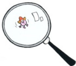
Une particule \beta est un électron...