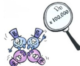
Une particule \alpha est constituée de deux protons et de deux neutrons. C'est un noyau d'atome d'Hélium.

Ces émissions s'accompagnent de la transmutation du pauvre \text{U}^{238} en un individu marginal d'une autre famille (un isotope rare et instable de cette famille) puis, de rechute en rechute, après avoir transité, entre deux crises, par diverses autres familles, il finit par se transmuter définitivement en un isotope stable de la famille Plomb: \text{Pb}^{206} .